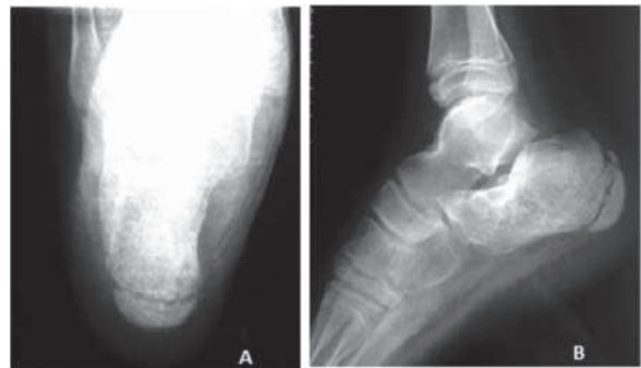
Figura 7. Control Radiográfico Caso A. A) Proyección axial de Calcáneo. B) Proyección lateral.

No existe consenso sobre qué método es el más adecuado para el tratamiento de fracturas de calcá-