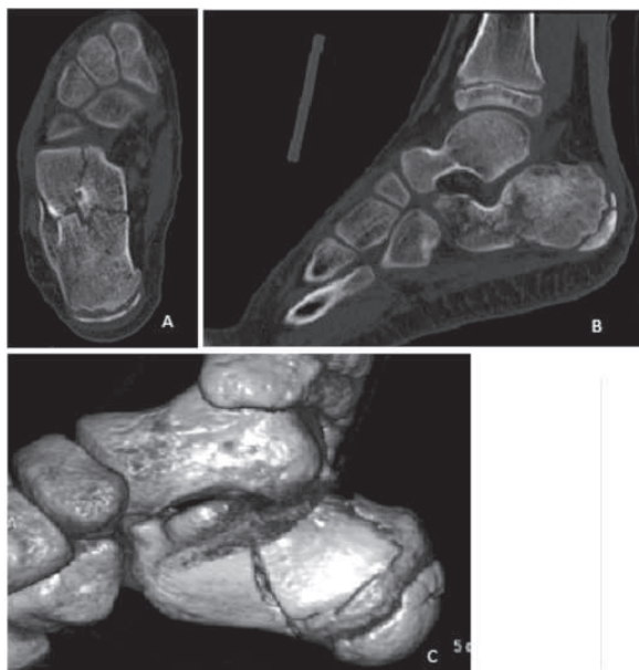
Figura 2: Imágenes de TAC. Caso A. A) Corte Axial . B) Corte Sagital. C) Reconstrucción tridimensional