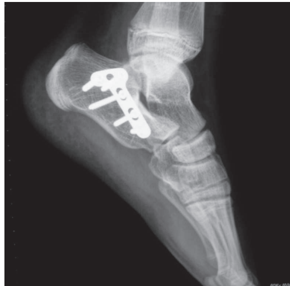
Figura 8. Control radiográfico caso B. Proyección lateral.

neo en la edad pediátrica (9,10) . En los últimos años, con la mejora de las técnicas de diagnóstico por la imagen y el incremento de los traumatismos de alta energía, han aumentado las publicaciones sobre estas lesiones y con ello la necesidad de llegar a un acuerdo sobre su manejo (11) .