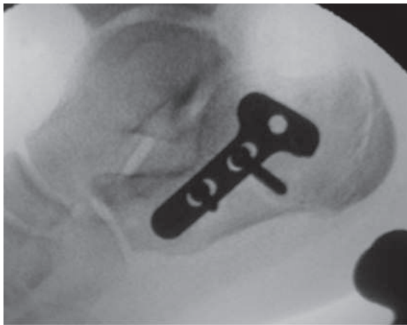
Figura 6: Control escópico intraoperatorio.