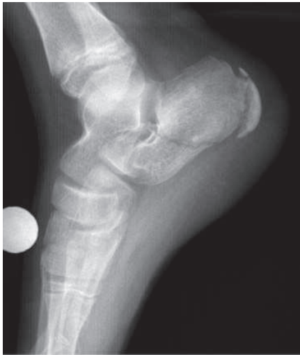
Figura 1: Radiografía lateral de pie. Caso A.