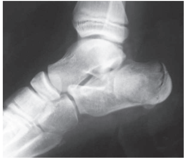
Figura 3: Radiografía lateral de pie. Caso B.